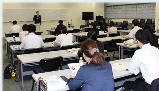
テキスト 『巡回監査実践講座』