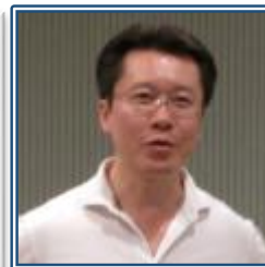
鳥山委員長（社長役）