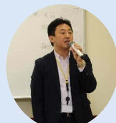
根本マネージャー