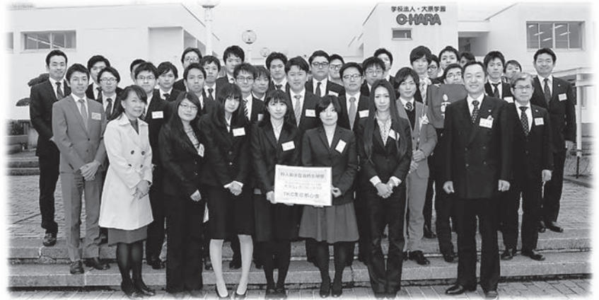
受講者73名、内当会29名参加